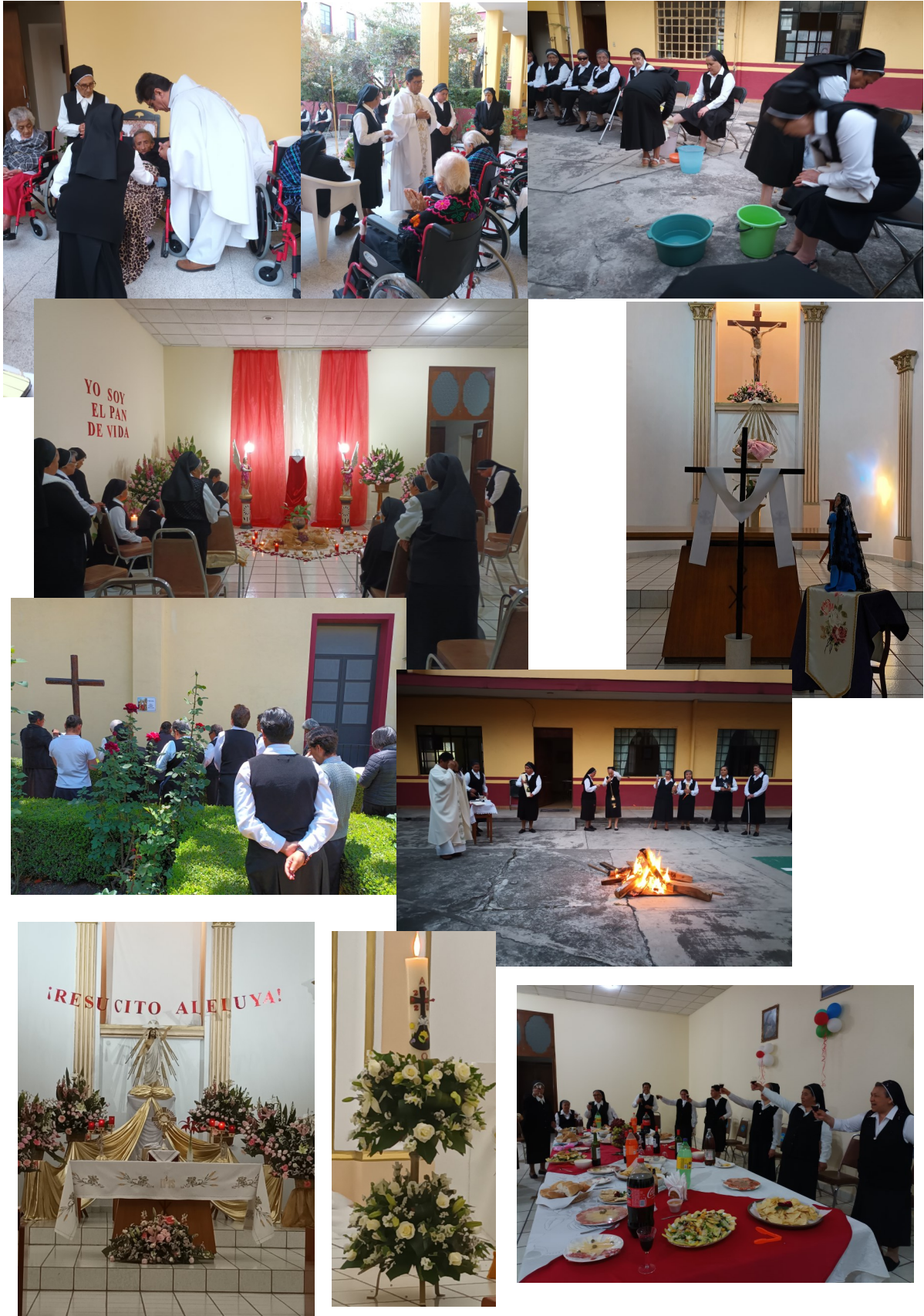
FELICES PASCUAS DE RESURRECCIÓN